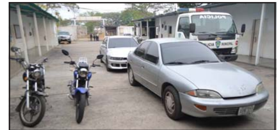
Retenidos vehículos y motos por la Policía Municipal.

En éste sentido resaltó el director de la PMB, que la retención de los vehículos se cumplió en razón que los conductores se encontraban circulando fuera del horario establecido; por los Gobierno Nacional y