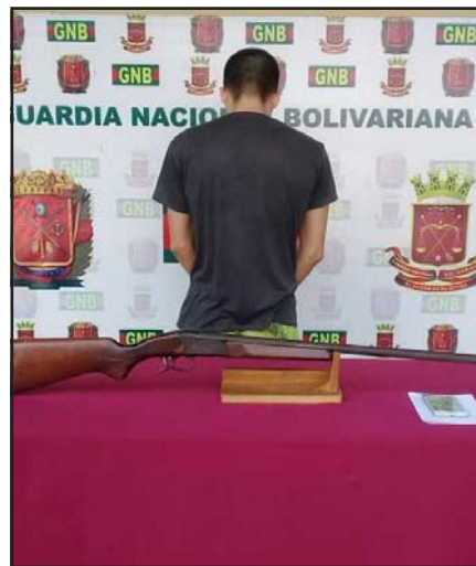
Aprehendido por porte ilícito de armas en Pedraza.