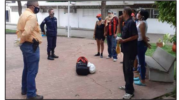
Charlas reciben ciudadanos que incumplen cuarentena

Igualmente como parte del plan preventivo contra el Coronavirus, los funcionarios de la Policía del Estado Barinas, a través del Servicio de Investigaciones Penales, procedieron a dictar charla de concienciación, a ciudadanos de la parroquia Corazón de Jesús, que circulaban fuera del horario establecido, orientando el uso del tapabocas, la cuarentena social, lavado de