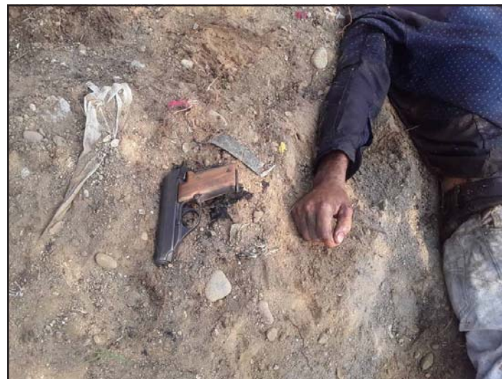
Neutralizado «El Gusano» al enfrentar a miembros del Comando DESUR.

En éste sentido el General Leonardo Vinci, enfatizó que los efectivos militares siguen con el despliegue táctico en la zona, así como en otras zonas del estado, a fin de dismantelar