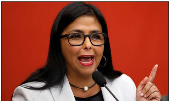
La vicepresidenta de la República, Delcy Rodríguez

La vicepresidenta de la República, Delcy Rodríguez, informó que en las últimas 24 horas fueron detectados cuatro nuevos casos de contagios por coronavirus en el país, por lo que asciende a 159 el número total de positivos detectados desde que se reportó la llegada de la enfermedad a mediados del mes de marzo.