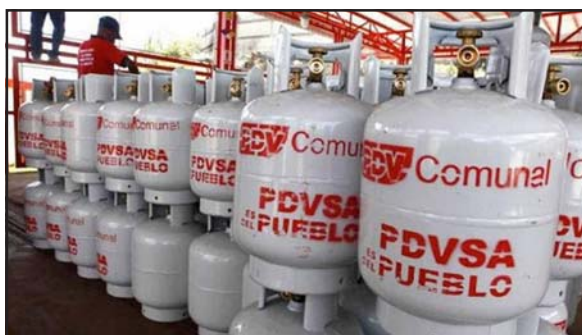
Vecinos de Ciudad Varyná esperan entrega de Gas.