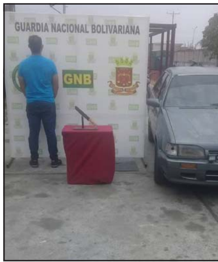
Aprehendido por resistencia a la autoridad en incumplimiento de cuarentena social.