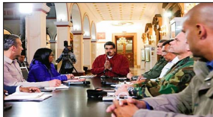
Nicolás Maduro, presidente de la República

Pido, junto al cese de las amenazas militares, el fin de las sanciones ilegales y el bloqueo que restringe el acceso a insumos humanitarios, tan necesarios hoy en el país», continúa el texto. En la misma línea, Maduro solicita al pueblo estadounidense que «no permita que su país se vea arrastrado, una vez más, a otro conflicto