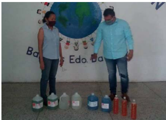
Entrega de material hizo presidente del CMB a Fundacern.