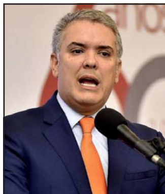
El presidente de Colombia, Iván Duque

«Colombia no se pueden referir de manera despectiva hacia los venezolanos, como si fueran personas que no participaran en la sociedad. No podemos caer en la xenofobia, ni en la estigmatización, ni mucho menos en tratar de lastimar a un sector que hoy es víctima, no solo por lo que ocurre en su país a raíz de la dictadura, sino también de lo que ha acarreado la pandemia del coronavirus en los países donde residen actualmente», dijo a través de un video difundido a través de su cuenta en la red social Twitter.