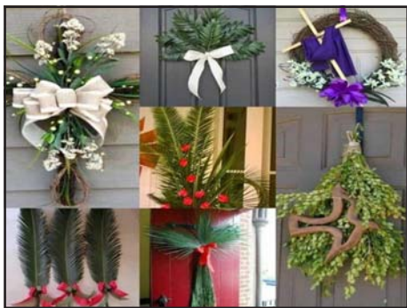
Este Domingo de Ramos la iglesia ha invitado a colocar una rama en la puerta de sus viviendas

También la iglesia ha recordado que se inicia la Semana Mayor, fecha oportuna para afianzar la fe y esperanza en Dios