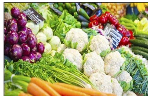
Precio de alimentos y verduras siguen en ascenso

Las amas de casa se quejan, porque nadie hace nada para ponerle un freno al aumento de precios de alimentos como del dólar paralelo